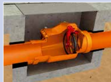
Ochrona przed gryzoniami