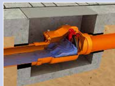
Zablokowana klapa - ochrona przed „cofką”