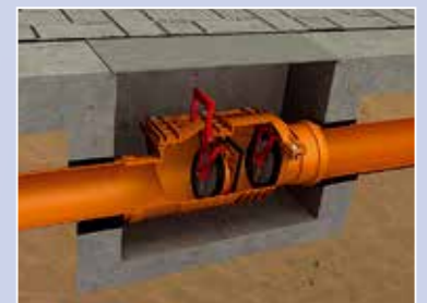
Podwójna ochrona przed gryzoniami