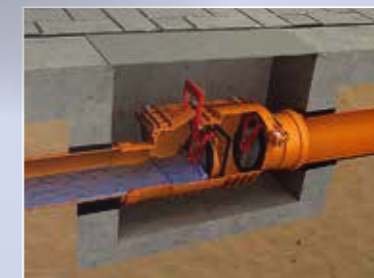
Zablokowana klapa - podwójna ochrona przed „cofką”